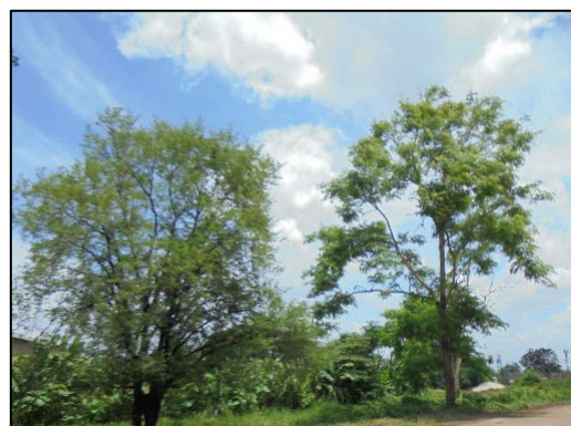
รูปที่ 1-3 (ต่อ) พื้นที่สีเขียวโดยรอบโครงการ