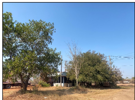
รูปที่ 1-3 พื้นที่สีเขียวโดยรอบโครงการ